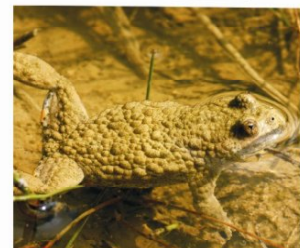
Gelbbauchunke