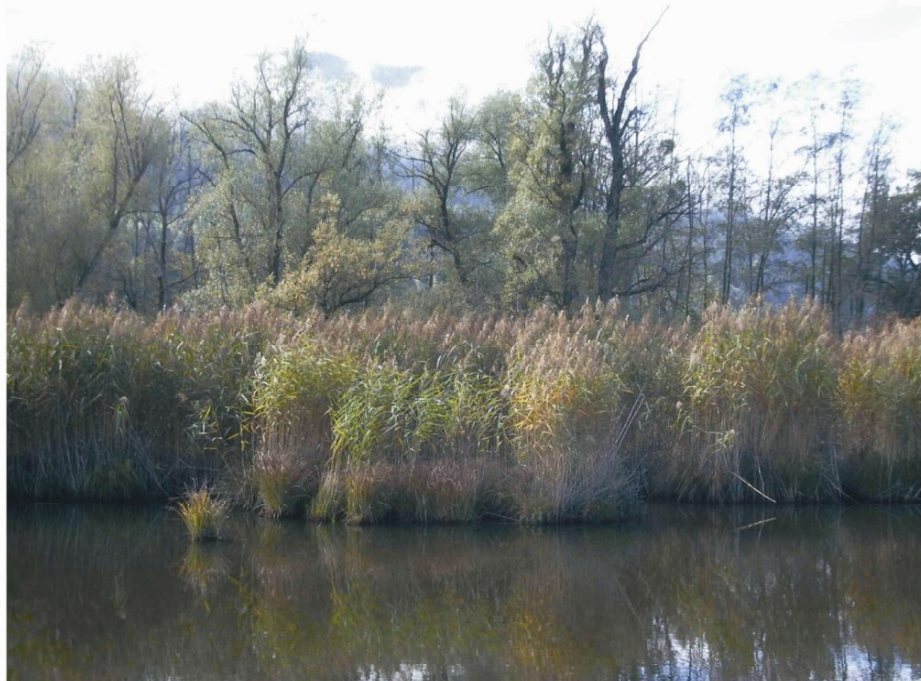
Die Gamperlacke bei Liezen

Die Lurche profitieren von dem reichen Insektenleben, das sich in den Kleingewässern einstellt. Und andere Arten wiederum tun sich an den vielen Lurchen gütlich. Ob Hecht oder Ringelnatter, Iltis oder Fischotter, Reiher oder Storch – wo es viele Lurche gibt, wird jeder Tierbeobachter auf seine Kosten kommen. Denn es gibt viel zu sehen.